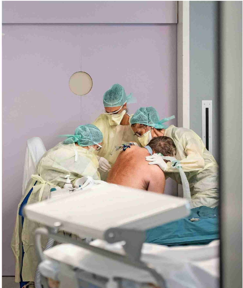
Auf der Intensivstation braucht es pro Patient etwa fünf Pflegendе.

Die SVP-Fraktion will dazu eine Interpellation einreichen, die den Regierungsrat auffordert, die entsprechenden Auswertungen vorzunehmen, um zielgerichtetere Massnahmen ergreifen zu können. Ich denke, dass man zum Beispiel am Euro-Airport oder beim Wiedereintritt in die Schweiz per Auto einen Schnelltest obligatorisch anordnen könnte, statt eine ganze Beizenszene lahmzulegen», sagt Weibel.