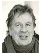
Jörg Kachelmann ist Unternehmer und Meteorologe für kachelmannwetter.com

Die Bereitschaft der Medien, für Klicks geradeheraus zu lügen und dies konsequent und über längere Zeit durchzuziehen, besorgt einen insofern, als Menschen auf diese Lügengeschichten hereinfallen. Das mag bisher auf Wetter- und Klimathemen beschränkt sein, weil das Wetter sich vor Gericht nicht gegen die freierfundene Berichterstattung wehren kann. Es rüttelt dennoch an den Grundfesten des Journalismus, wenn Wettermärchen heute zur Normalität geworden sind. Ich möchte nicht aufgeben, zu hoffen, dass die Paralleluniversen eines Tages nicht mehr da sein werden. Wehret den Anfängen.