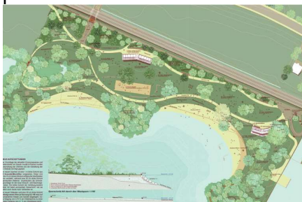
Studienauftrag "Weiterentwicklung Brüggli Zug" 2021/22 Seite 16

Die Ergebnisse sind sehr interessant – es könnte dort - aufgrund der Tiefe des dortigen Areals ein attraktives Strandbad entstehen – genau was die Stadt Zug braucht – aber nicht mehr dort wo die Stadt gerade auf der Oeschwiese am See eine aufwendige und vorallem auch teure Erweiterung (heutige Schätzung CHF 13 Mio.) des bestehenden Strandbades plant. Auf den untenstehenden Visualisierungen sind mögliche „Sandstrände“ gut sichtbar.