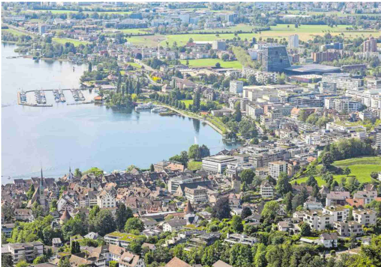
Grösste Finanzkraft auf kleinstem Raum – das ist Zug.